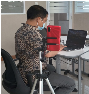
Posisi camera perangkat zoom